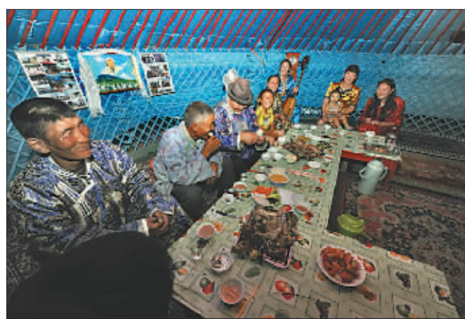
↓晚上7点50分,在蒙古包里,带着3位农民工参加全家聚会的团结一家其乐融融。