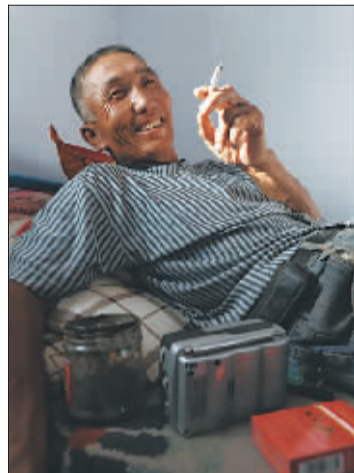
←下午5点19分,“马倌”额尔登布正在屋里休息。在牧场日常伴随着他的有“3件宝”:一盒烟、一个简易烟灰缸和一个半导体收音机。