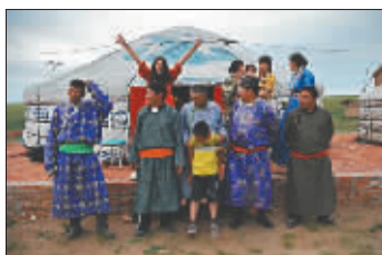
←晚上,身着民族服装的5位牧马人来到团结哥哥和弟弟的蒙古包参加聚会。