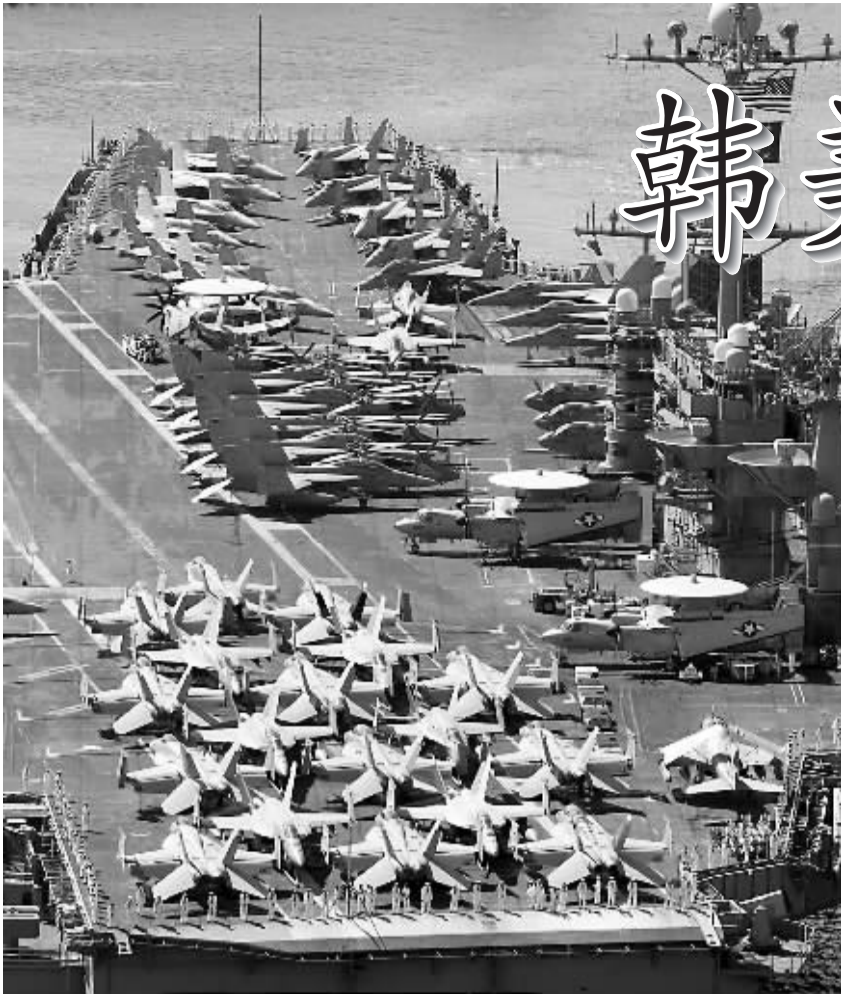
7月21日，参加韩美联合军事演习的美国航空母舰“乔治·华盛顿”号抵达韩国釜山港。

最终，韩美还是做出了让步，在21日举行的韩美外长和国防部长“2+2”会议上，本次“不屈意志”军演的地点被确定在“日本海”，美军“乔治·华盛顿”号航母也转入日本海部署。但韩美宣称未来将在日本海和黄海举行一系列军演，主要演习放在日本海进行，黄海部分规模有所缩小。