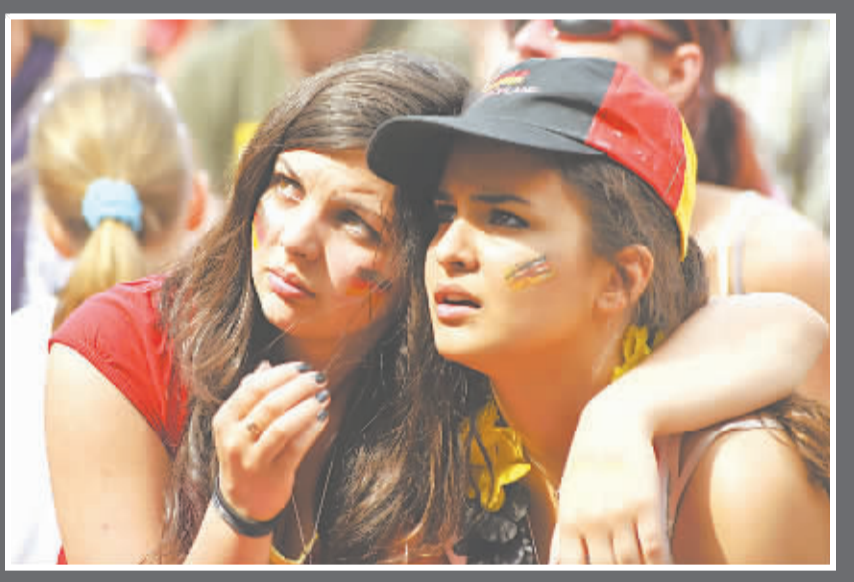
▶世界杯开幕式后一直兴高采烈的德国球迷，半决赛后终于露出失望的表情。