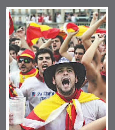
西班牙球迷欣喜若狂

所赐。 作为西班牙队的中场“发动机”,哈维是全场攻防转换的枢纽。早在小组赛阶段,哈维就在传球次数、传球成功率和威胁传球数等三项技术统计上,排名世界杯所有参赛选手之首。本场比赛,哈维106次传球92次到位,15次长传13次到位,跑动距离高达12321米。普约尔所进一球,正是来自于他的角球助攻。 而作为西班牙队边路进攻支点的伊涅斯塔,其个人突破和传球同样犀利。不要忘了,在他们身边,还有一个传球成功率同样位居世界杯参赛选手前三位的阿隆索。 有了这样的配置,也就不难理解西班牙队在本场比赛中的各项技术统计均大幅领先于德国队——控球率57%比43%,射门16比6,头球成功率71%比28%…… 德国队在本届世界杯屡试不爽的快速进攻,在西班牙队严密的逼抢和娴熟的传接配合中往往被化于无形……本场比赛,德国队攻入对方球门30米区域内的次数都屈指可数。“西班牙队踢得很聪明,而我们则显得有些急躁。”赛后,德国队中场施魏因斯泰格如此解读球队的失利。 击败了本届世界杯中风头最劲的德国队,博斯克的球队有理由对冠军产生更多渴望。西班牙《阿斯报》,甚至在赛后第一时间就在网站上打出“西班牙万岁”的标题。 “我们在本届世界杯中的开局不好,球员们进入状态有些慢。但他们都是经验丰富的队员,直到何时调整好自己的状态。西班牙队有实力去谈论世界杯冠军。”博斯克在赛后表示。而西班牙队队长卡西利亚斯已经在展望与荷兰队的决赛:“这将是西班牙历史上最重要的一场比赛。” (本报约翰内斯堡7月8日电)