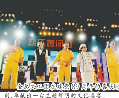
全总文工团在建党89周年的喜庆时刻,奉献出一台主题鲜明的文化盛宴。

7月2日晚,东营这片美丽的热土上歌声如潮,掌声迭起。全总文工团“建功黄河口,颂歌献给党”大型主题晚会,作为2010