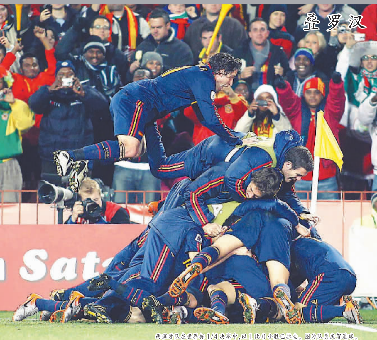
西班牙队在世界杯1/4决赛中，以1比0小胜巴拉圭。图为队员庆祝进球。