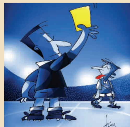
“红牌”PK黄牌 莱昂(哥伦比亚) 以牙还牙——你给我黄牌！我给你“红牌”！