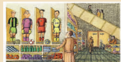
采购 扎玛尼(伊朗) 大赛期间也是各大职业联赛俱乐部大佬们“采购”球星的绝佳时机啊。