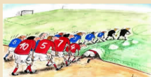
另类入场式 克里斯蒂纳(罗马尼亚) 刚入场就怯阵了，这样的球队还能在场上撑90分钟吗？