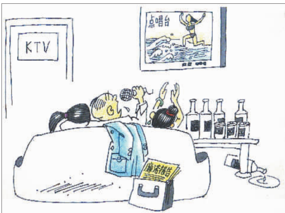
说的没有唱的好听