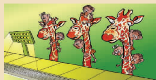
场外观众 雷赛普(土耳其) 世界杯第一次来到了非洲，看，场外没票的小观众自有妙招！