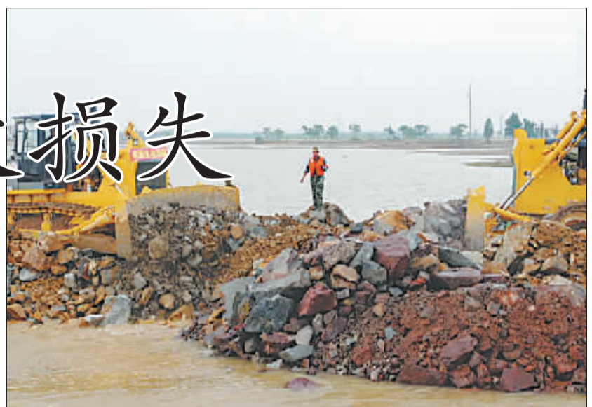
6月27日,推土机将砂石推下,唱凯堤决口封堵工程实现合龙。

了解到,截至目前,因为洪水的影响,全省已经有9000多个旅游团申请退团,牵涉人数超过15万人。据了解,受损最为严重的景区主要集中在鹰潭、抚州、上饶、吉安等地,其中鹰潭的龙虎山景区受灾最为严重,景区内的竹筏、船只几乎全部被洪水冲走。江西省旅游局局长王晓峰表示,江西旅游的直接损失(硬件损失)目前估计可能超过了30亿元以上,还有一些间接的损失,比方说(景区)道路和其他的损失还很难去估计。连日的洪水也给群众的菜篮子造成较大的影响,蔬菜价格上涨明显,时令蔬菜普遍比水灾前每公斤上涨了一元左右,而且,由于大量农田和菜地被淹,本地蔬菜供不应求,城镇居民普遍担心菜价一路上涨。