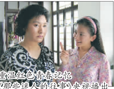
重温红色青春记忆 《那些迷人的往事》央视播出

黄梅戏的“草根”本质与“时代性”决定了她的剧本是取之于民间,源自于群众的。老百姓的生活中充满了许许多多的故事,但如今具有现代气息的新剧创作欠缺,剧本的单一性总有一天会让人失去兴趣,如何定位影视及戏剧的发展方向,解决当前面临的剧本荒已迫在眉睫。