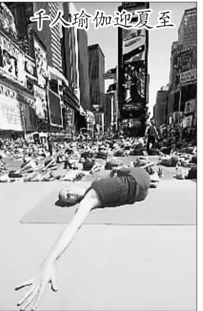
千人瑜伽迎夏至 6月21日,瑜伽爱好者在美国纽约时报广场练习瑜伽。当日,上千名瑜伽爱好者陆续聚集在纽约时报广场,用集体瑜伽的方式迎接夏至的到来。

本报讯 据英国媒体报道,巴基斯坦警方22日表示,巴安全部队在该国西北部地区抓获了一名德国国籍的基地组织成员嫌犯。 这名现年20多岁的德国男子穿着穆斯林女性的全身罩袍,从头到脚都被遮得严严实实。他与两名当地男性和一名女孩同乘一辆车,试图伪装成一家人,其中一名当地男子也戴着妇女所戴的头巾。 当地一名警方高官说,这些人所乘的车辆是在从北瓦济里斯坦地区驶往班努地区的途中,在一处安检点被截获的。(宗和)