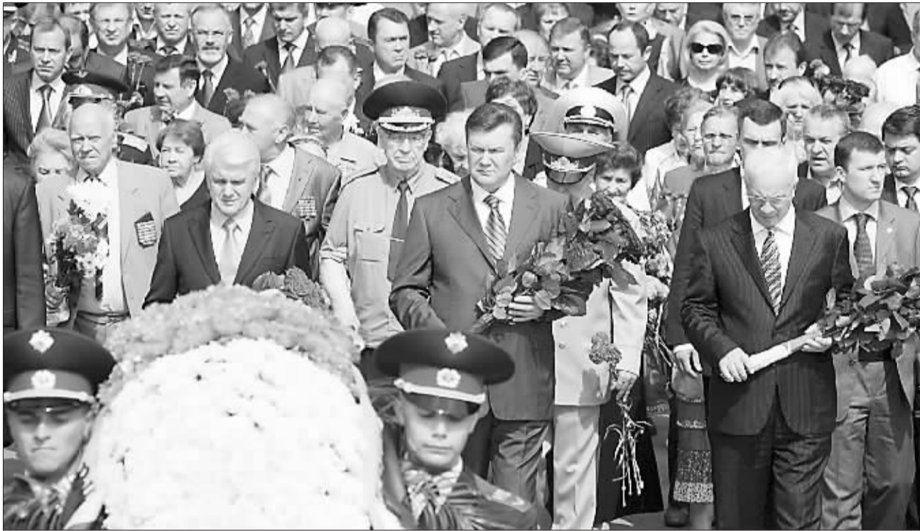
乌克兰举行活动 纪念卫国战争 6月22日,乌克兰总统亚努科维奇(中),总理阿扎罗夫(右),议长利特温(左)在基辅举行的纪念活动上向无名烈士纪念碑献花。当天是纳粹德国入侵苏联纪念日,乌克兰总统亚努科维奇、总理阿扎罗夫和议长利特温在基辅出席纪念活动,并向无名烈士纪念碑献花。

据新华社金沙萨6月22日电(记者舒迪)布拉柴维尔消息:刚果(布)黑角市医院一名不愿透露姓名的医生22日向新华社记者透露,21日午夜发生在距该市60公里处的火车脱轨事故死亡人数已从先前的约50人上升到60余人,另有400余人在事故中受伤,死亡人数有可能进一步上升。 刚果(布)大铁路公司当天早些时候宣布,该公司一列火车21日午夜在距离该国第二大城市黑角60公里处发生事故,初步估计约有数十人伤亡,事故原因尚不清楚。救援人员已赶往现场,部分获救乘客已被送往附近医院治疗。