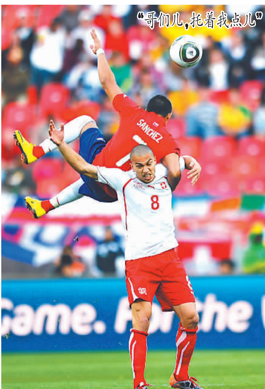
6月21日,智利队球员阿·桑切斯(上)与瑞士队球员格·因勒争顶。

尽管法国队在本届比赛中的表现乏善可陈,但齐达内仍不愿给法国队提供战术方面的建议。他表示,尽管自己对主教练多梅内克没有“好感觉”,但只要多梅内克在法国队主教练的位置上,他就会尊重多梅内克。“我不会当法国队主教练,我希望球队现在能平静一点。我会站在他们背后支持他们。”