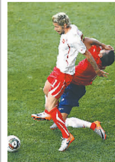
6月21日,在世界杯小组赛H组首轮智利对瑞士的比赛中,瑞士中场贝赫拉姆射门对手比达尔,被红牌罚下。