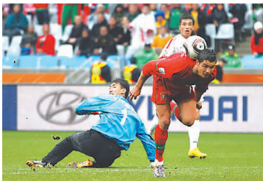
C罗的进球像杂耍一样。

台。凭借着贴身逼抢和顽强防守,朝鲜队和对手在比赛的前20分钟基本平分秋色。在长久的等待之后,葡萄牙队的新一代核心C罗终于挺身而出。上半场第29分钟,C罗在右路右侧组织配合,蒂亚戈左脚低传禁区,梅雷莱斯插上劲射破门。