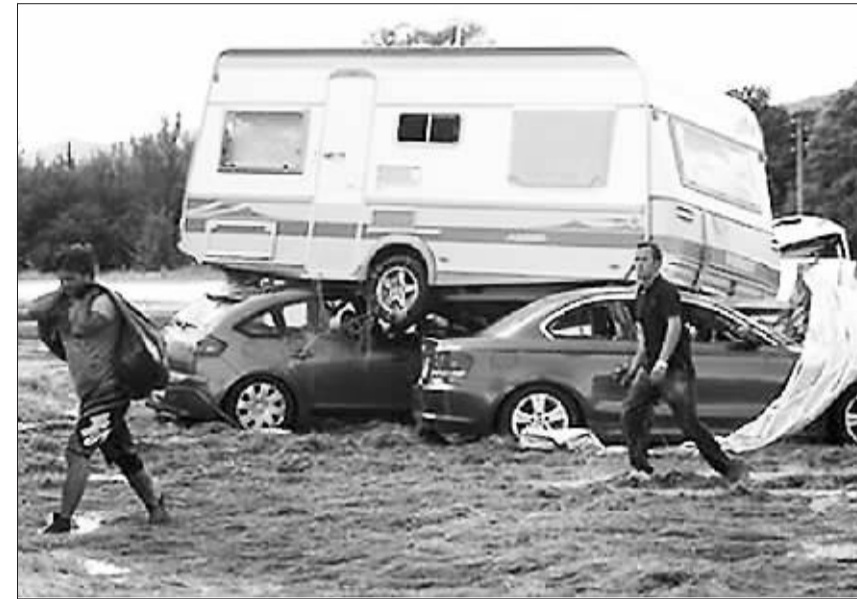
法国南部瓦尔省近两日出现大范围强降雨而天气并引发洪水,死亡人数现已达20人,另有12人失踪,并蒙受了较为严重的财产损失。这场强降雨为1827年以来“最严重的一场灾害”。图为洪水退去后。

周边国家敞开门户,让难民避难,并表示目前“急需”为他们提供人道援助。正在柏林访问的吉特雷斯通过德国电台说:“这个国家的邻国及国际社会必须尽一切所能,帮助临时政府恢复当地的和平和稳定。”