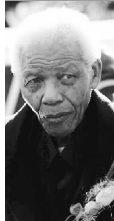
6月17日,南非开国元首曼德拉曾孙女泽娜妮的葬礼在其学校举行,曼德拉携夫人如期出席。 泽娜妮是在世界杯开幕前夜参加完音乐会后回家途中遭遇车祸而不幸遇难的,91岁高龄的曼德拉也因此取消了出席世界杯开幕式。图为满怀悲痛的曼德拉在葬礼中。

多的政府公开调查终于在今年6月15日以报告的形式呈现在世人面前。当天,首相卡梅伦在议会宣读一份政府调查报告时说,当年在德里民权游行中丧生的民众皆为无辜受害者,英国军队在向游行民众开枪时不是因为受到了游行者的汽油炸弹或石块的袭击,且开枪前没有做出任何警告,英军士兵枪击平民的行为是“不正当和不可原谅”的,是“错误的”。卡梅伦表示,他代表政府和向死难者表示“深深的歉意”。