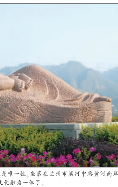
雕塑家何鄂创作的获奖作品《黄河母亲》1986年建成,成为兰州的城市名片。就是这样一著名的雕塑却屡遭盗版。

据来凡介绍,雕塑界近年来的盗版侵权特别严重,像著名雕塑家潘鹤为深圳创作的《开荒牛》在国内早已遍地皆是了,一件作品在很多地方出现的现象非常普遍,甚至有人