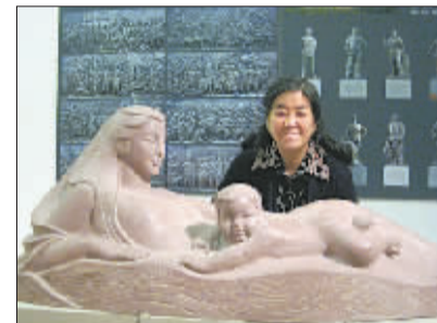
山西省大同县发现的盗版《黄河母亲》大型雕塑。