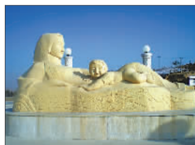
山西省大同县发现的盗版《黄河母亲》大型雕塑。