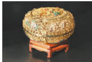
▲花丝镶嵌作品——百事和合