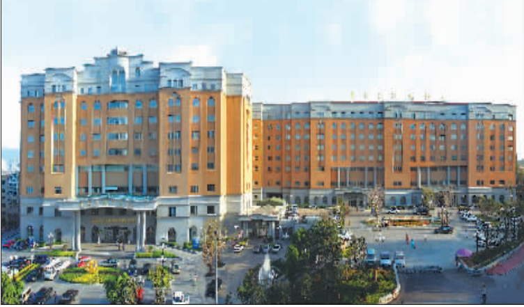
▲12.3 万平的一体化、现代化、人性化的医疗大楼,被誉为“现代医院建筑的典范”