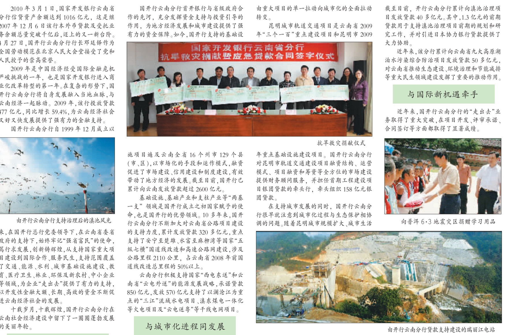
抗旱救灾捐赠签约仪式