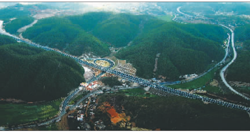
由国开行云南分行贷款支持建设的安楚高速公路