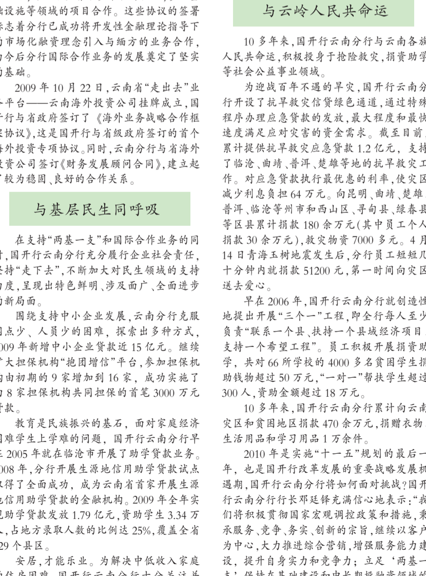
向普洱6.3地震灾区捐赠学习用品

与云南经济齐腾飞 10多年来，国开行云南分行有力支持了云南经济的腾飞，也实现了自身的跨越式发展。优秀业绩的背后，是一系列锐意创新的实践。 与城市化进程同发展 近年来，国开行云南分行紧扣城市化进程的脉搏，大力支持城市基础设施建设，通过融资推动市场建设和规划先行，致力于推动城市公共设施的市场化运作，并不断从大城市向中小城市、县城延伸，积极推动经济增长