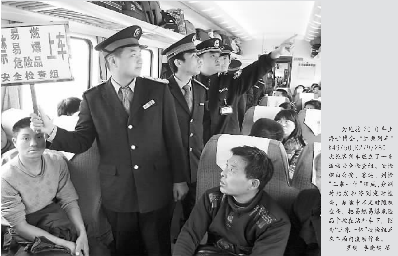
为迎接2010年上海世博会,“红旗列车”K49/50、K279/280次旅客列车成立了一支流动安全检查组。安检组由公安、客运、列检“三乘一体”组成,分别对始发和终到定时检查,旅途中不定时随机检查,把易燃易爆危险品卡控在站外车下。图为“三乘一体”安检组正在车厢内流动作业。

赵某开着一家小公司,恰需一笔资金维持正常运转,于是找到了这家担保公司,交了几万元手续费后,就等着资金打入账号。但赵某从此既没有收到贷款,也没有接到贷款担保公司的电话,且贷款担保公司的电话再也打不通了,始终处于关机状态。