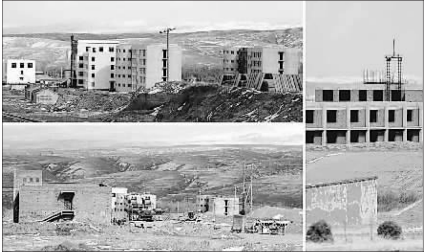
图为清水河县王贵窑乡山坡上的烂尾楼(拼版照片,摄于 4 月 12 日)。

清水河县副县长韩宇接受记者采访时说,早在 1998 年清水河县便有建新区想法。当时一位上级领导到清水河县考察工作,认为