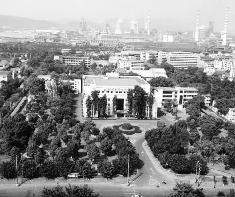
韶钢集团公司办公楼

四是不断改善居民生活环境和员工工作环境。随着公司加大技术改造、淘汰落后同时加大资源综合利用、节能减排力度,建设资源节约型、环境友好型企业方面取得明显成效,同时公司加大绿化力度,绿化率已达97%以上,社区