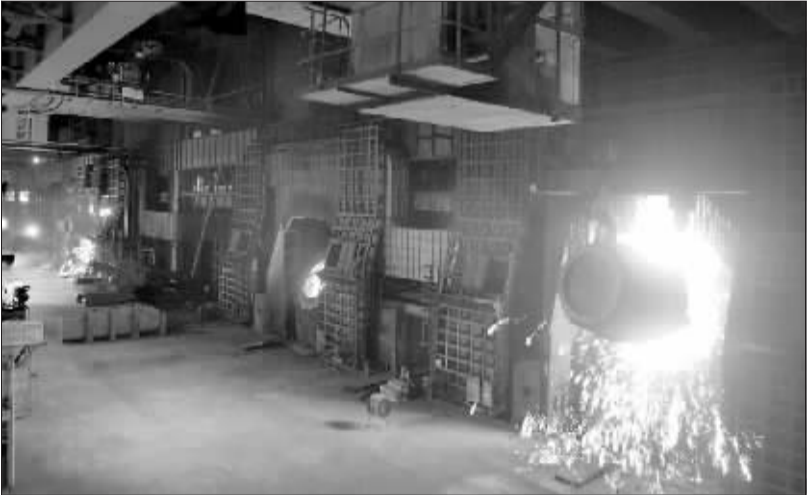
韶钢三座 120 吨炼钢转炉

余子权认真贯彻落实科学发展观,以高新技术改造传统产业,以信息化推动工业化,近5年来,投资90亿元,通过技术改造,逐步淘汰了能耗高、污染大的小焦炉、小高炉等落后生产能力,建成一批具有国内领先水平的技术改造工