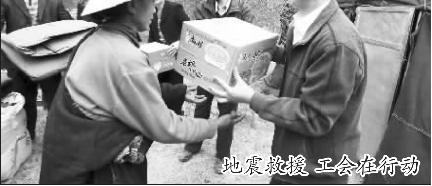
地震救援 工会在行动

4月17日下午,在青海省总工会玉树地震灾区临时办公点刚刚起起的困难职工帮扶中心帐篷前,青海省总工会的领导向在玉树地震中受灾的部分玉树环卫工人和四川、甘肃等地来玉树打工的农民工发放了生活物资,当天下午一共帮扶救助了53位受灾群众。之后,他们将把救助范围进一步扩大。