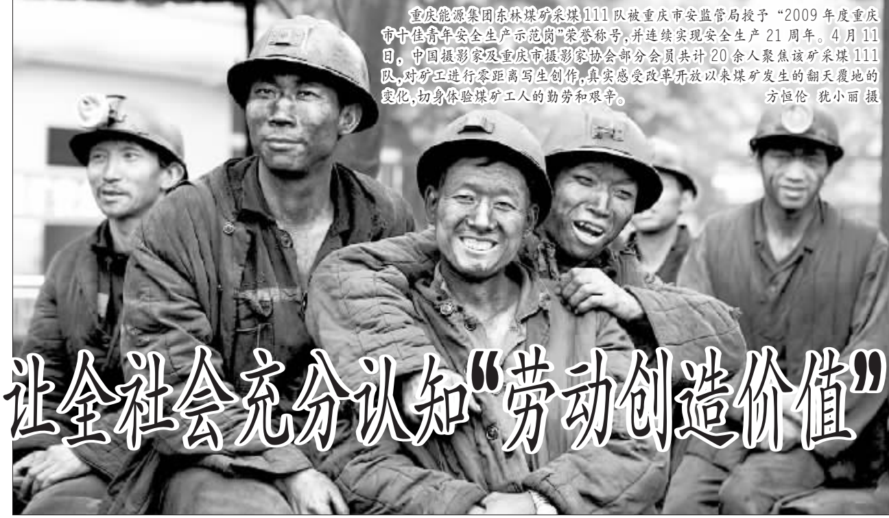
重庆能源集团东林煤矿采煤111队被重庆市安监局授予“2009年度重庆市十佳青年安全生产示范岗”荣誉称号,并连续实现安全生产21周年。4月11日,中国摄影家及重庆市摄影家协会部分会员共20余人聚焦该队,对矿工进行零距离写生创作,真实感受改革开放以来煤矿发生的翻天覆地的变化,切身体验煤矿工人的勤劳和艰辛。

多少年来,“劳动光荣、劳动创造价值”的口号一直激励着我们班组职工立足岗位吃苦耐劳、甘做奉献。可当我们为自己的奉献感到光荣、为自身所创造的价值感到骄傲时突然发现,这些一直激励着自己的美丽词汇,更多时候是闪耀在想象的王国里,现实中,我们许多班组职工的收入、待遇处在企业倒金字塔的最低端,各企业之间收入差距越来越大。社会上歧视劳动、躲避劳动的现象比比皆是,劳动者治于人的观念仍在影响着许多人。对岗位价值的判断和选择,甚至也让我们中的许多人开始怀疑自身岗位的价值和所从事的劳动的价值。在又一个“五一国际劳动节”即将到来