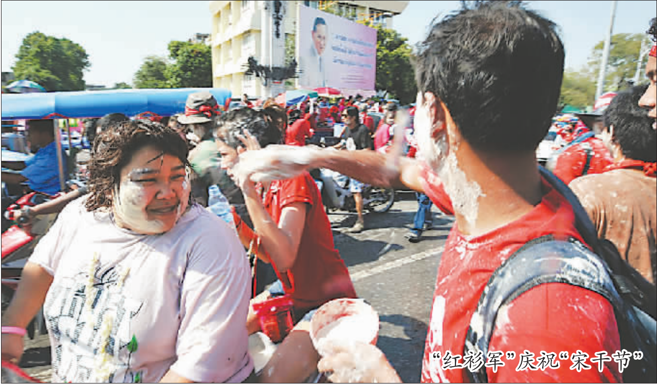
“红衫军”庆祝“宋干节”

报告说,从长远看,亚洲发展中国家的金融、汇率、财政政策也需要调整,以保证本地区更好地适应后危机时代的世界。