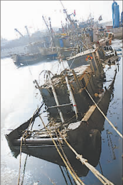
海冰挤压 渔船破损

2月22日，停靠在大连市旅顺口区北海渔港的一艘渔船船舱进水下沉。 近几日，大连湾渤海北端结冰海域冰层开始融化，部分停靠在这里的渔船出现船舱进水、船体下沉的情况。渔民解释，这是由于海冰长时间围困挤压船底部引起的，当地渔政及保险公司已经介入，并叮嘱渔民密切观察被困在海冰中的船只情况。