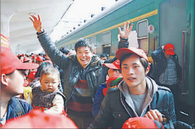
浙江宁波一企业包列车接工人返厂

2月22日，宁波一家服装企业包了6节车厢，将回乡过年的550余名安徽阜阳籍员工接回宁波。