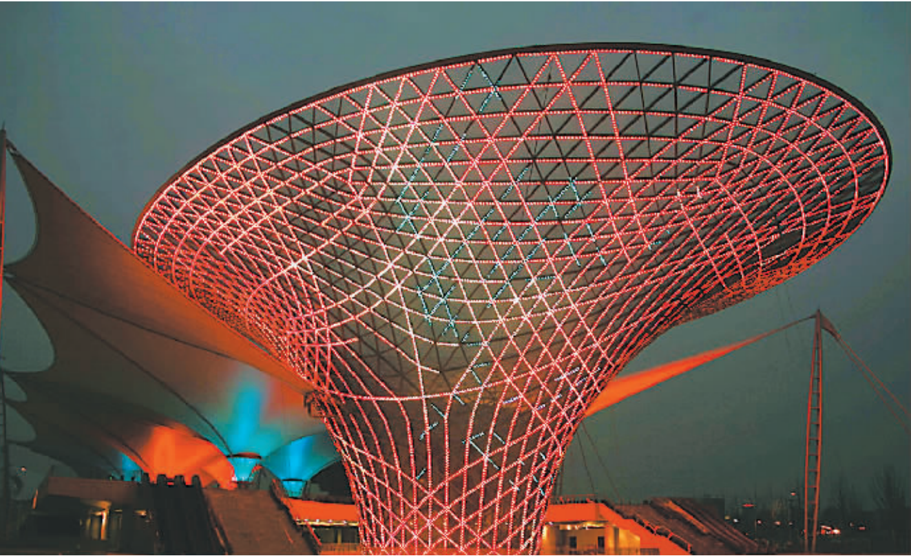
世博轴竣工，阳光谷“视”灯