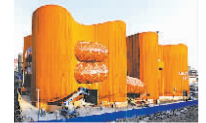
澳大利亚馆

这是一座令人倾心的百花城、童真之城：大大的“蘑菇”作为城市的下水道，大街上形态各异的汽车不“喝”汽油，而是快乐地品尝着可口的草莓酱。百花城的主人是一位个头还没有黄瓜高的孩子，他就住在这个城市的铃铛花街上。俄罗斯著名作家尼古拉·诺索夫先生在1954年出版的名作《小无知历险记》中这样为读者勾勒、描绘他心中理想城市。大胆而富有创新精神的俄罗斯人将把诺索夫半个世纪以前的童话理想付诸实践，为世界各地参观者讲述一个美妙的童话。