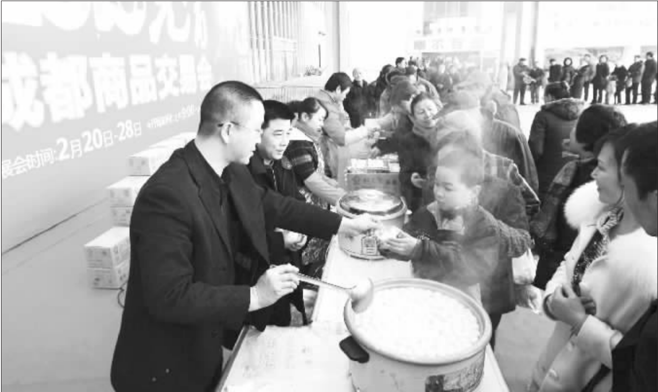
图：市民排队领汤圆

第三，互联网服务投诉持续增多。互联网服务投诉量2009年比2008年上升了38.9%，位居2009年投诉增幅第3位，互联网服务投诉呈持续增长势头。在互联网投诉中，反映网络游戏服务的相对较多，主要是游戏服务商随意变更服务内容、服务范围和服务