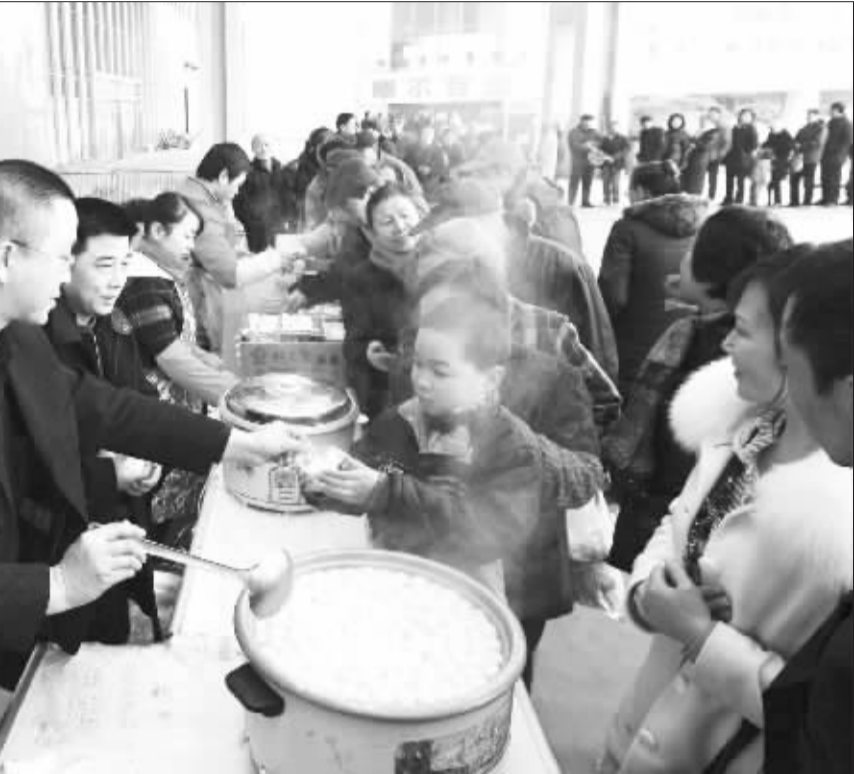
图：市民排队领汤圆