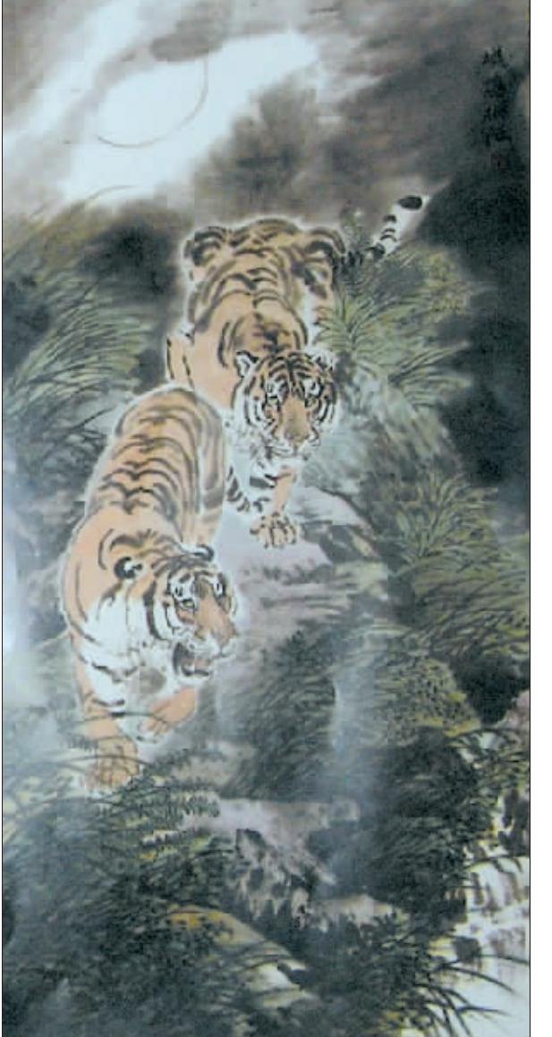
潜 行 (国画) 阴衍江