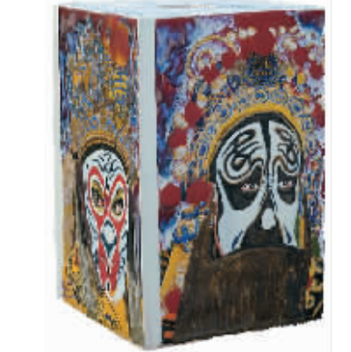
国 戏 窑变瓷艺

瓷艺色釉可以这样欣赏 章朝辉·京剧窑变的中国魂 在江西景德镇,有一位特立独行年届40的年轻陶艺家,他叫章朝辉,整日痴迷于用陶瓷高温颜色釉创作“中国老屋”系列。他的作品“中国京剧”系列,与传统的陶瓷国画表现形式背道而驰,与火爆的传统陶瓷艺术市场决裂,“守贫择彩”,近乎神话,传奇般的彩色釉窑变,被他经营的如大自然造化般和谐,形成了他自己独特的陶瓷绘画语言和美学理念。(小灵)