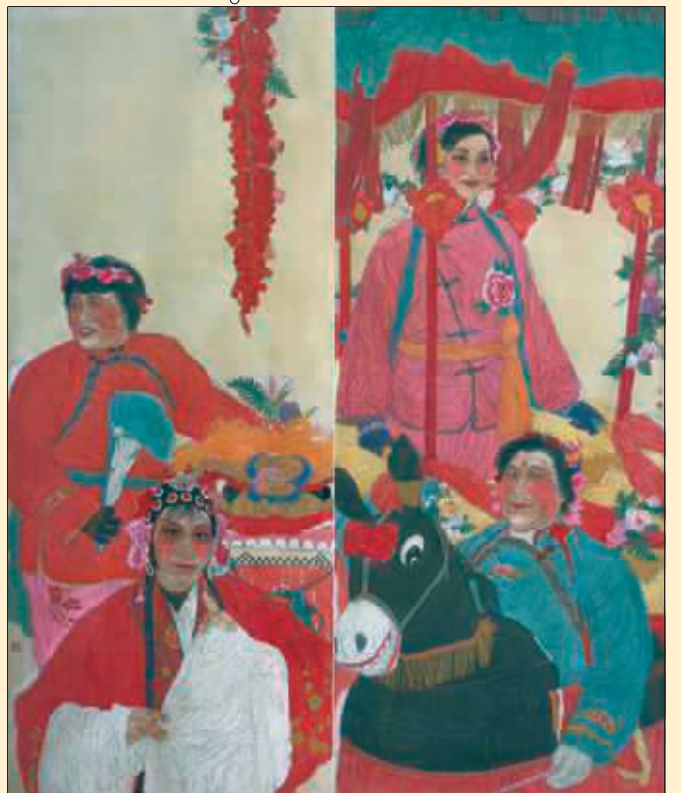
年·万象更新(国画) 李 宁