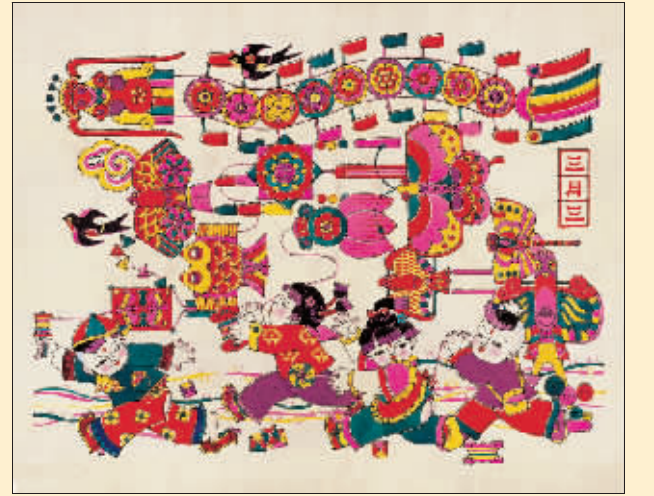
三月三(新年画) 臧恒望 李洪修