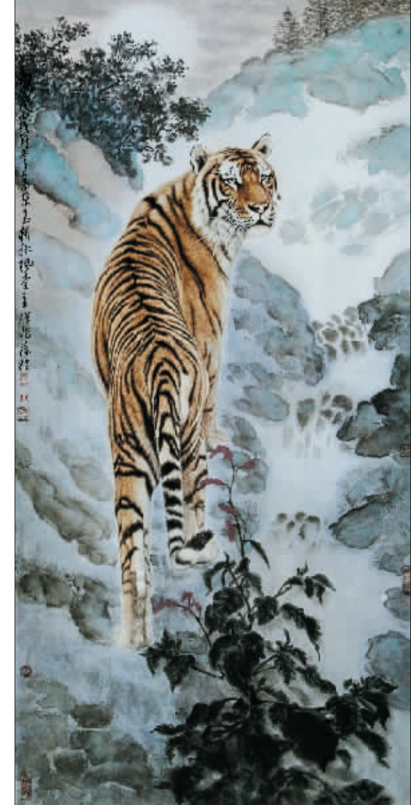
朝 阳 (国画) 张葆桂