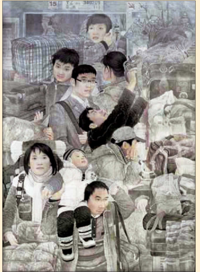
回 家(国画) 秦焕炎