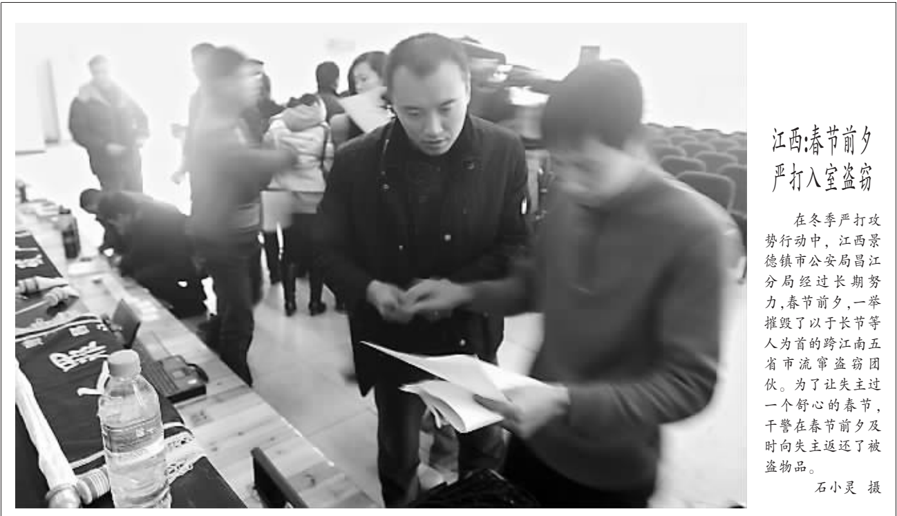
江西:春节前夕 严打入室盗窃

“新中国漫画”,这是神界公司在实践中提出的理念。吸取中国文化精髓、借鉴国外先进技术、开创规模化流水线式创作模式,神界公司在海内外打开了市场。2005年,韩文版《西游记》漫画在韩国顺利上市,次年其日文版又成功打入日本漫画市场。此后,漫画《水