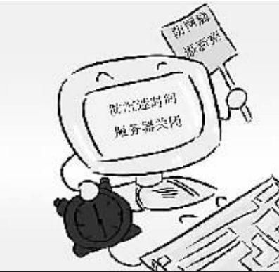
运营商计划推出儿童浏览器和家长管理系统应对网瘾。

可以说,对互联网进行监管是一种国际惯例,实施必要管理,引导互联网健康发展是国际共识,任何一个负责任的国家都不会对本国的互联网发展放任自流。