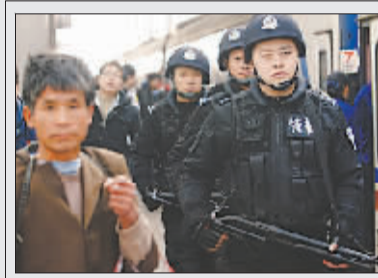
蚌埠铁路公安处为保证春运安全,特警在进行实战演练。李健 摄

一是落实售票视频监控。为防止票务人员卖“大户”、私自囤积车票等违规行为。二是加强车站售票、退票场所控制。每日在发售预售票的前两个小时,民警对售票厅排在购票队伍前端人员进行甄别,及时清理囤积车票人员。三是强化对代售点的监管措施。督促代售点从业人员按规定程序和要求制售车票。四是专门抽调特警、刑警等50余名警力组成专门打击小分队,不间断地开展打击整治。五是动员举报,警方奖励。