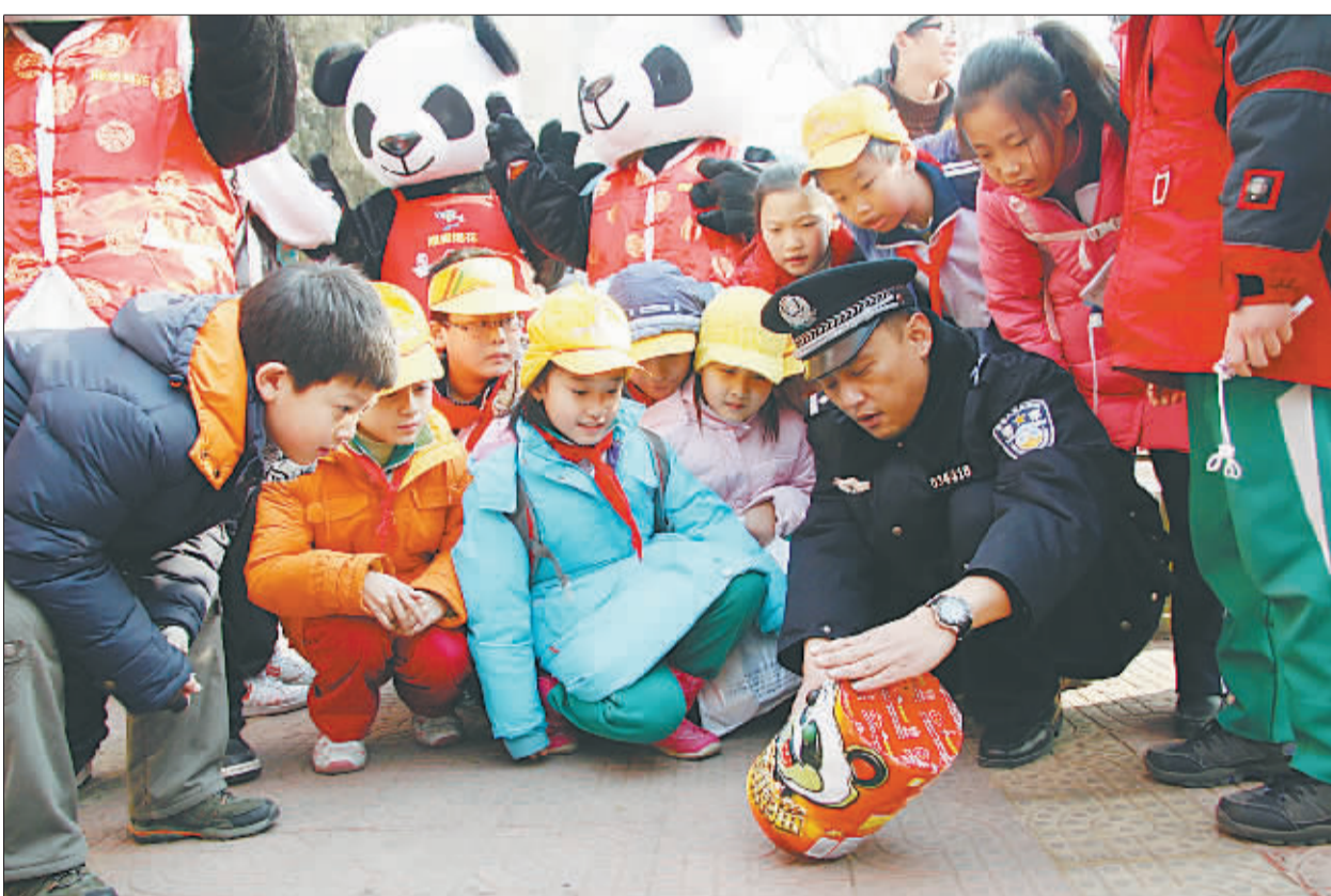
北京:民警进校园宣传烟花安全燃放