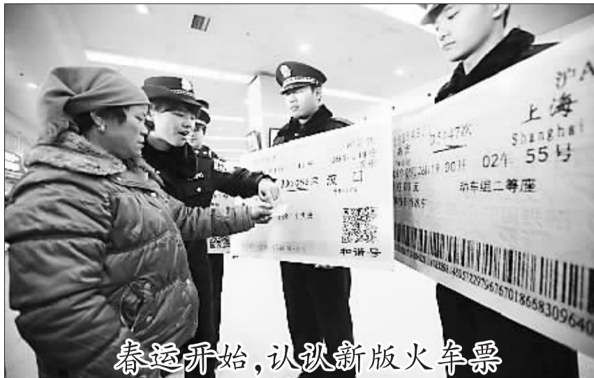
春运开始,认识新版火车票

“具体操作是,起初是利用自有资金,发展到一定阶段是创业资本,再往后是股权资本,接着是担保公司和银行信贷,再后来是发行债券,企业发展壮大之后再进入到上市这个环节。”他说,“实际上是把各种金融产品的创新,不同金融行业的优势互补起来,最后使得民营企业的发展能够有一条完整的金融产业链来推动。”(吴名)