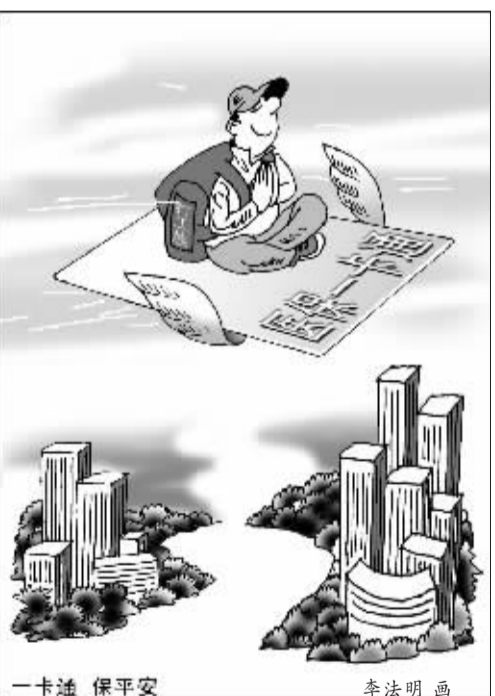
一卡通 保平安 李法明画

这一活动将本着“权威、公开、公正”的原则,从就业、分配、三农、社保、住房、医疗卫生、教育、环境和社会福利等十余个方面,全面评价城市的民生建设,届时将发布中国城市民生建设年度总报告,综合评定“中国最关爱民生的城市”和“中国最关注民生的城市”。