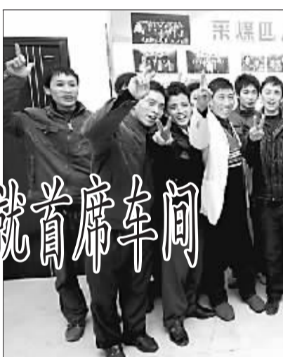
裴沟矿采煤二区班组成员合影

首先,是从体制保证读书作为工作任务一样交给职工。区队、班组通过考核、奖惩等管理手段,让职工认识到读书是成才的重要途径,让读书成为大家人人可成才,人人是人才的保证。其次,要让“职工书屋”成为班组成员休闲娱乐的驿站。区队、班组通过开展读书会、知识竞赛、读书征文等活动,把职工多读书、读好书培养成为自觉行为,在潜移默化中激发大家读书的兴趣,开阔视野,积累知识,提升自身综合素质。第三,要加大“职工书屋”的吸引力,按照实际工作的需要和职工的兴趣爱好,购买一些有益于身心健康的新书、好书,最大限度地满足职工在读书学习方面的渴望和要求。同时让“职工书屋”成为班组成员学习的阵地,成为丰富职工生活、提升工作质量的加油站、助推器。