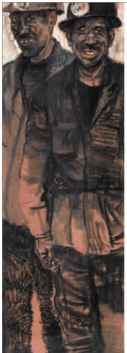
开采阳光的人(水粉)

获奖的《开采阳光的人》、《5.12 我有一个理想》、《和平——2009》等作品中,许多不属于传统画种。多元化的大美术概念,正通过这一平台,得到充分展示。新的创作理念,正以多种多样的题材、丰富多彩的形式、生动感人的艺术形象,把积极的人生追求、高尚的精神境界、健康的生活情趣传递给公众,带给人们审美的愉悦和向上的力量。