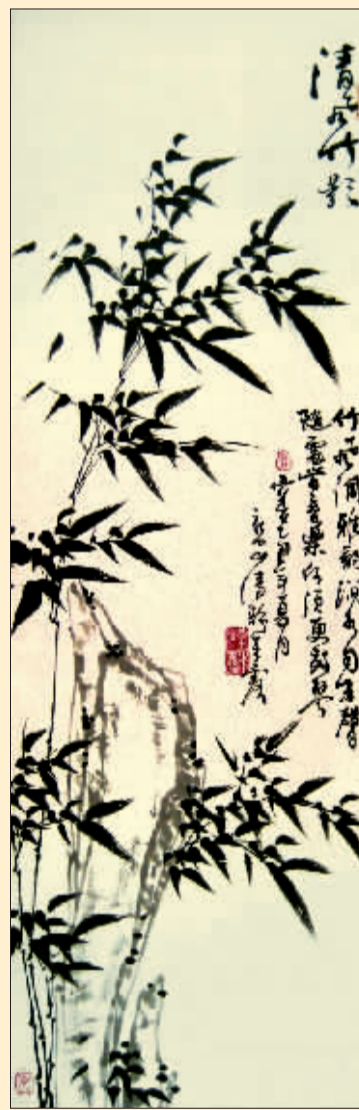
清风竹影(国画) 吴来露