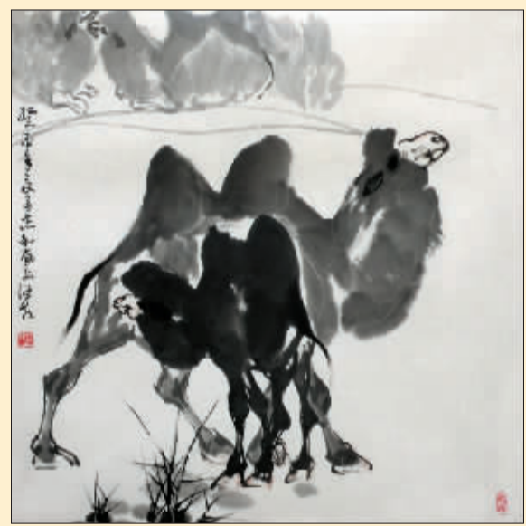
哺乳图(国画) 杨志和