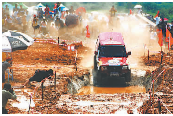
6月20日,“苏仙杯”王仙岭生态公园越野汽车竞赛(第三届华南越野汽车竞赛)在郴州苏仙区开赛。

至于中国车手的培养问题,更是成为中国赛车界近年来的热门话题。与逐年增多的赛事相比,中国车手特别是年轻车手的培养显得有些滞后。以已经开展了十余年的全国汽车拉力赛为例,虽然今年的每站赛事都有近百名