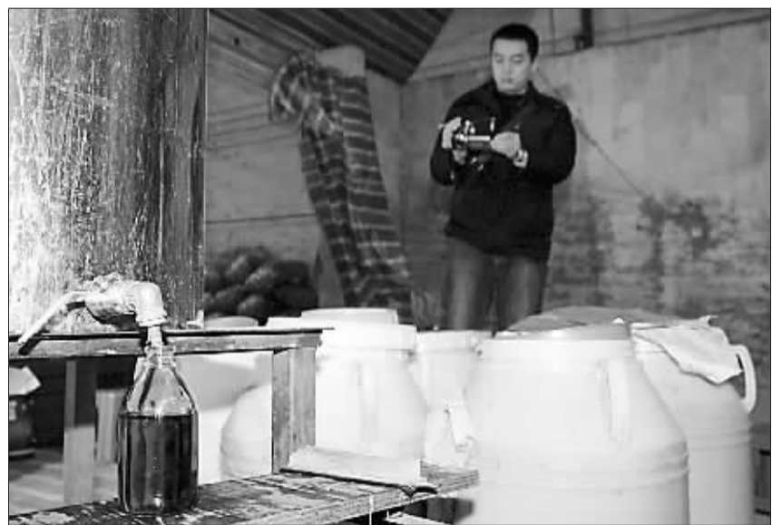
开赌场冲击派出所 强行干预村民选举

3. 在境内购买时查验过相关进口手续,且出卖人也提供相关进口手续,购车人认为该手续是合法有效而购买的,不能认定购车人走私。对于走私汽车,如已经车辆管理部门审核过户,购车人已经完全占有该车,只能追究走私人走私该车的违法所得,不能从购车人处没收该车。但如果经车辆管理部门审核,认为相关进口手续是虚假的,不能办理过户,因所购汽车无合法证明,则应当依《国务院办公厅关于加强进口汽车牌证管理的通知》予以没收。 (颜东岳 江西兴国法院)