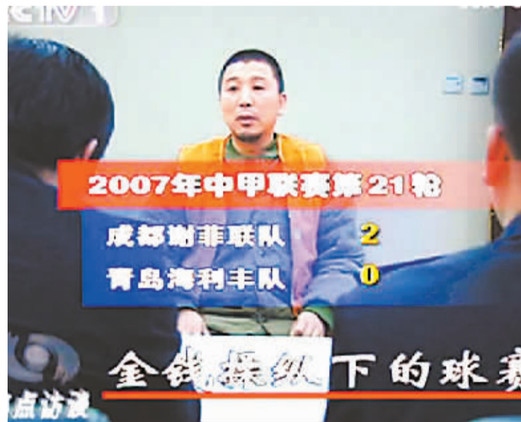
2009 年 12 月 11 日晚间,央视《焦点访谈》再次关注中国足坛反赌打假进展,尤可为对 2007 年 9 月 22 日青岛海利丰 0 比 2 负于成都五牛的中甲比赛的赌球细节进行详解。

“赌球假球”一直被视作阻碍中国足球发展的最大毒瘤,打击赌球应该越彻底越好。但中国足球要提高水平,反赌打假只是第一步。“真正要做的,是明晰责权利体系,制定出适合中国足球发展的科学规划和实施方案。反赌只是清源,正本才是关键!”北京市社科院体育文化研究中心主任金汕认为。