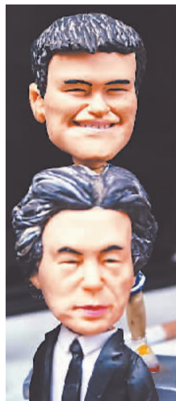
上海城隍庙,栩栩如生的人物面夺人眼球。前为中国电视台主持人李咏,后是篮球巨星姚明。

北京时间 12 月 17 日,姚明以上海男篮投资人的身份回到了上海,他将出席 12 月 19 日 CBA 新赛季的揭幕战。目前,全国各路