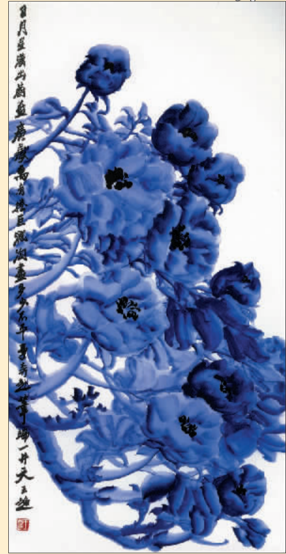
日月星汉出蔚蓝(国画) 王超