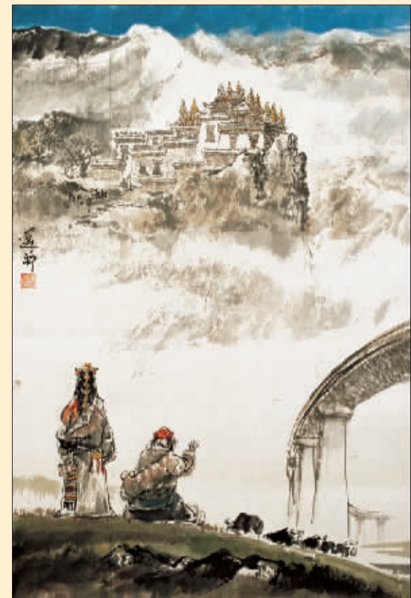
天路遥拜(国画) 法明