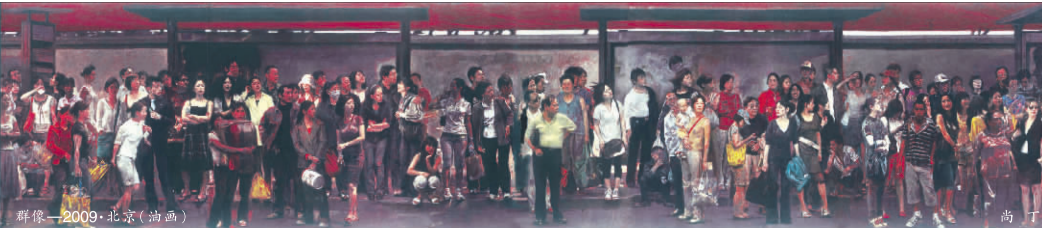
群像—2009·北京(油画) 尚丁