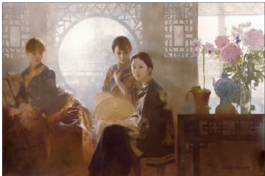
又见晨光(油画) 陈衍宁