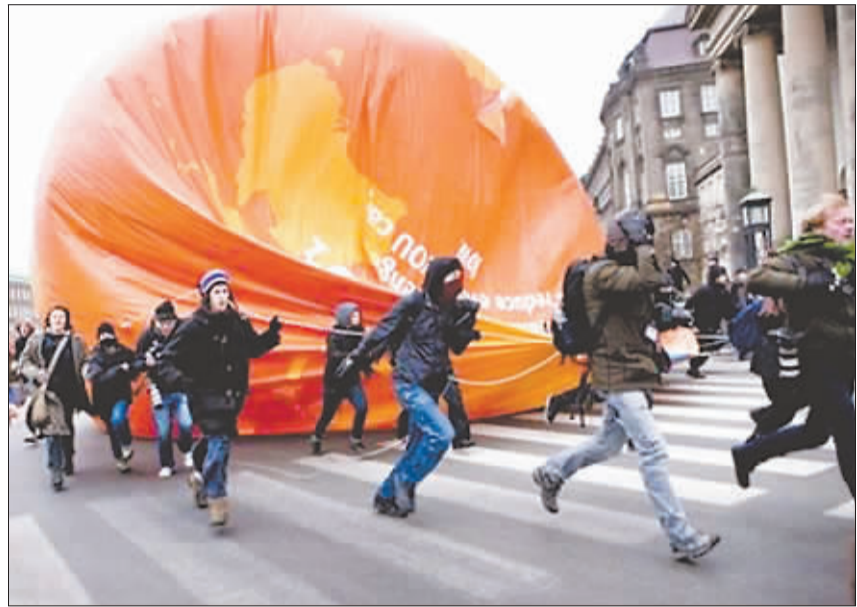
在联合国气候变化大会举行期间,每天都有众多示威者走上哥本哈根街头,呼吁各国采取行动保护地球,争取联合国气候变化大会取得进展。图为15日,一些示威者拖着巨型气球奔跑。

不管是经济复苏还是刺激就业,离开银行业的配合,奥巴马政府的目标都难以实现。因此,奥巴马仍然需要不断和银行业展开“磨合”,在加强金融监管的同时,也要与华尔街紧密合作,才能保证美国经济顺利运行。不能低估华尔街的实力,不能忽视他们的想法。