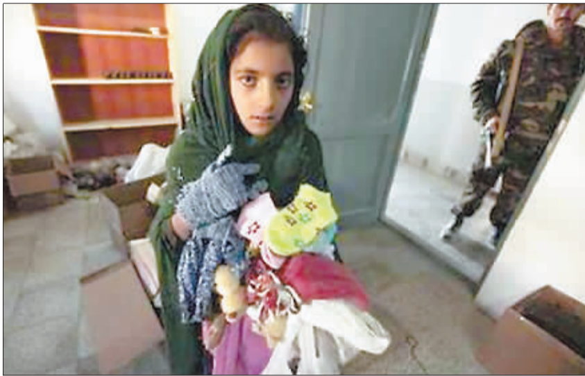
12月15日,在阿富汗首都喀布尔以南150公里的霍斯特省,一位女孩从阿富汗国民军开办的免费诊所里领到一些衣物。每周四,该诊所都要为邻近村庄的儿童进行体检并发给他们一些衣物和文具。

据悉,近年来中国流失海外文物回归最主要的方式是回购和捐赠,但一些极其珍贵的文物,既难回购又难获赠,讨还更是难上加难。美国大都会露出实话:很多博物馆超过90%的馆藏都是国外文物,如果真全部归还,这些博物馆就几乎被掏空了。目前,我们要从建立健全系统和立体化的文物追索体制入手,让这些流失海外的“国宝”早日回家。