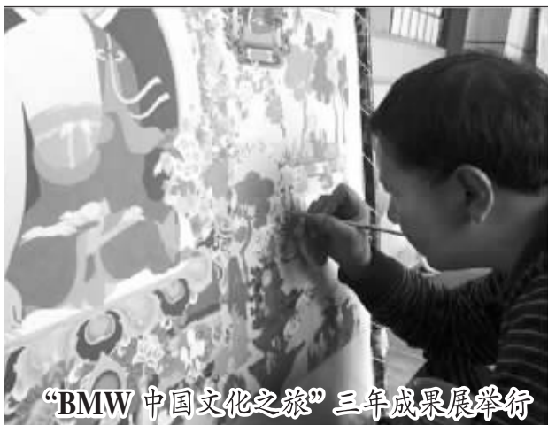
“BMW 中国文化之旅”三年成果展举行

实验室经济是此次昌平区支持的重点。从明年起,昌平区将每年安排不少于3000万元作为实验室经济发展的专项资金。企业自建实验室,或与高校、科研机构共建实验室,取得相应科研成果并产生经济效益的,都将获得资金支持,最高支持金额达到200万元。(冷丁)