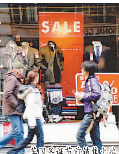
英国圣诞节前销售火热

目前,越来越多的公众和非政府组织开始关注墨西哥新闻工作者的工作和生活环境。其中最著名的马努埃尔·布恩迪亚基金会以1984年被暗杀的墨西哥记者马努埃尔·布恩迪亚的名字命名,定期向公众发布相关报告,呼吁整个社会关注墨西哥新闻从业者的处境,希望能为改善记者们险象环生的工作环境发挥一些作用。