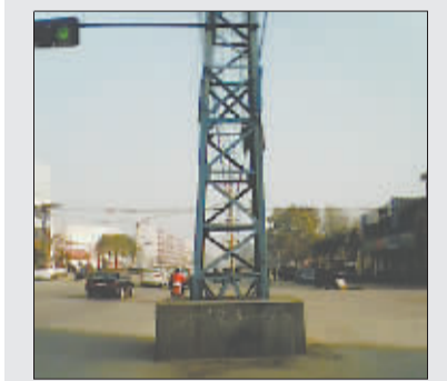
引发本次纠纷电线铁塔

被告城市建设管理部门认为,线塔不属于市政设施,被告不是线塔的所有人和管理人,不应该对这起事故承担责任。