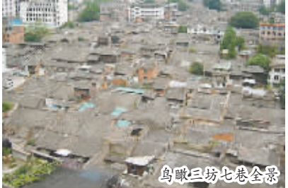
鸟瞰三坊七巷全景