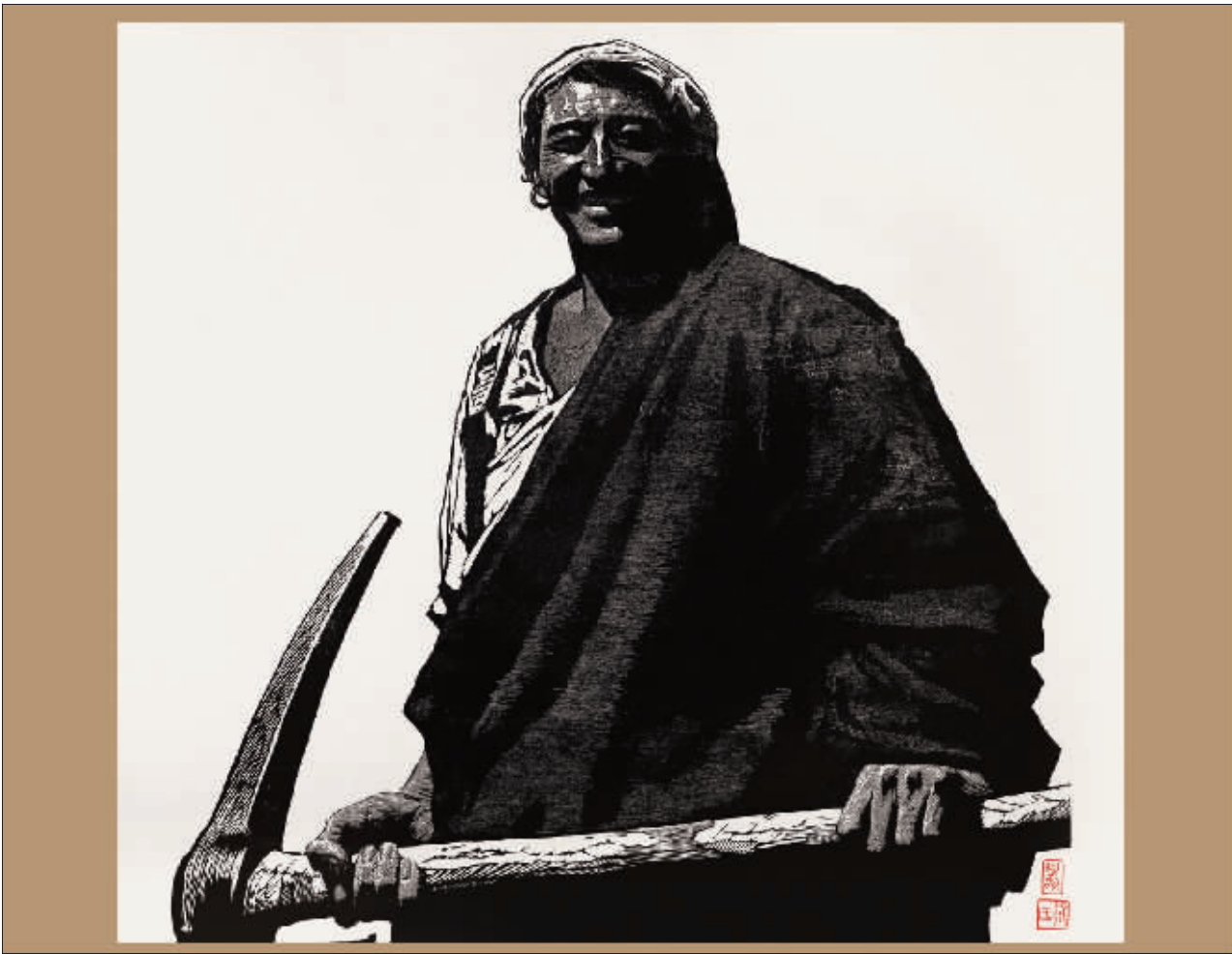
主人(版画) 徐匡阿鹤