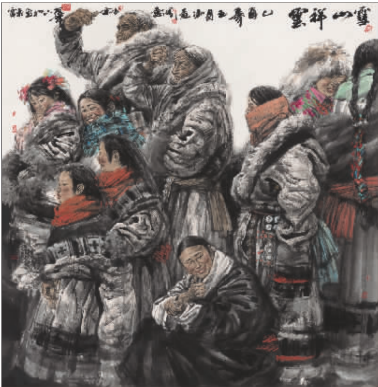
雪山祥云(国画) 冯远