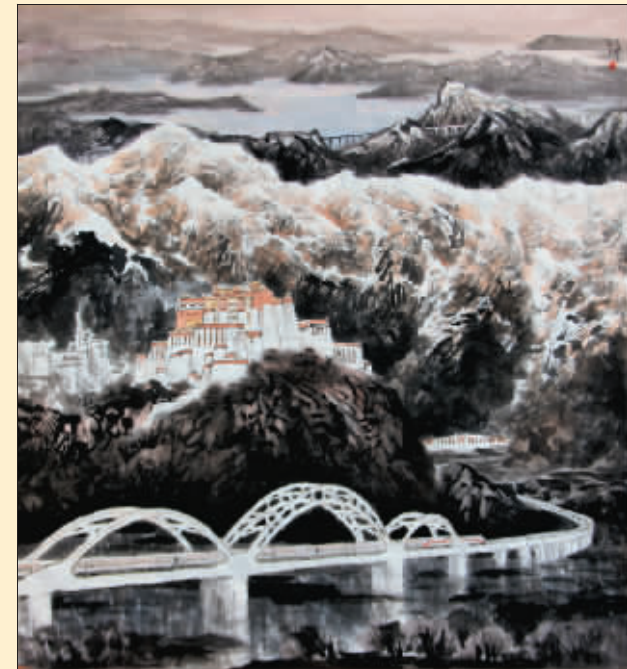
吉祥天路(国画) 董吉祥