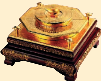
源源 百泰和合盘 (主创)黄维

据悉,四届文博会分会场活动将持续到2010年2月10日,开幕当天将举行“百泰和合盘”工艺品评选活动,这是四届文博会分会场的最大亮点,取和谐社会“和合,百吉百泰”之意。这不是一件一般意义上的艺术珍品,她凸显了民族文化博大精深的无穷魅力。“百泰和合盘”不仅树立起黄金艺术品典范,更是首个环境艺术珍品;她深蕴中华民族五千年文化智慧,以古鉴今,开心启智。四届文博会分会场活动期间还将举办全国工艺美术精品、燕京八绝精品、北京工艺美术精品展示展卖和中华民族艺术珍品展以及中华人民共和国国礼品展六大主题活动。这必将引起工艺美术界、艺术收藏爱好者及参观者的高度关注。