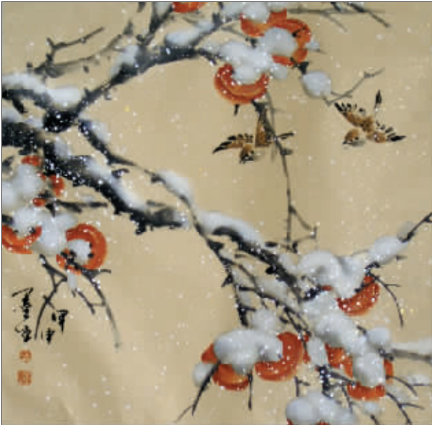
雪飞雀舞(国画) 田运友

耕阳把冰雪柿子作为立身选项,也兼功山水画和花鸟画的其他品类。梅、兰、竹、菊、牡丹、丝瓜、蜂蝶草虫等,在耕阳笔下皆成佳构。相信耕阳的画会越来越精妙,步子会越来越坚实。