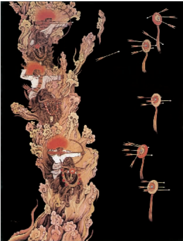
骑射图(布面重彩) 计美赤列