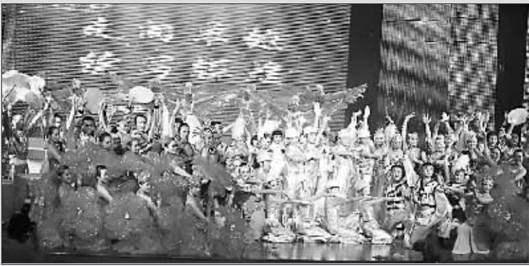
集团成立一周年庆祝活动