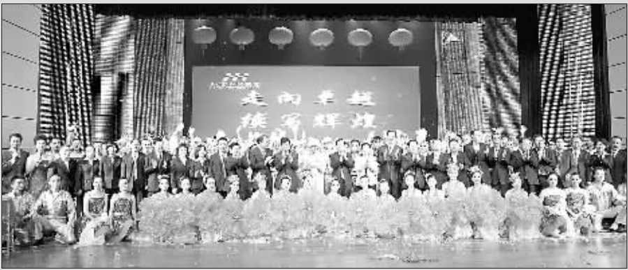
红云红河集团成立一周年庆典