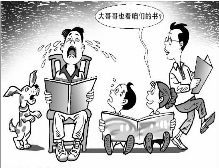
童年缺失 成长中补