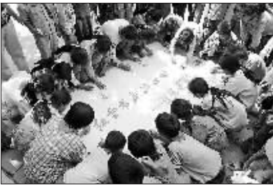
百书进百校活动