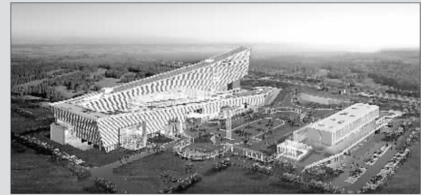
集团大楼鸟瞰效果图