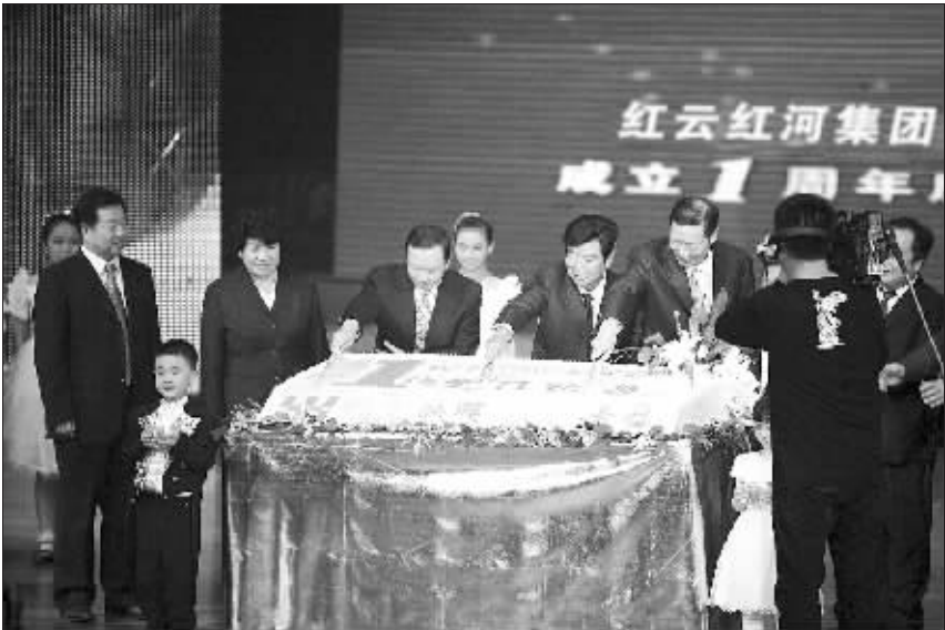
集团成立一周年庆祝活动

为一个企业的软实力,绝不亚于那一串串灼人眼目的经济数字,红云红河集团决策层深谙其道,从集团成立伊始,就坚持做一个有爱心、负责任的企业,始终坚持发展不忘回报社会的理念,勇担社会责任,积极支持各项社会文化公益事业。