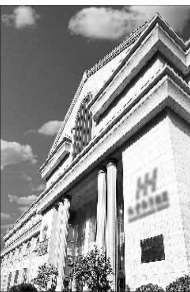
红云红河集团大楼