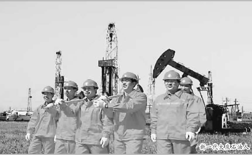
新一代大庆石油工人

在大庆油田，有一条不成文的规矩，凡是青工，大学毕业生入厂、入团、入党，第一堂课就是接受以“爱国、创业、求实、奉献”为精髓的大庆精神、铁人精神传统教育。使大庆精神、铁人精神深深扎根在每位油田职工心灵深处，伴随其职业生涯全过程。