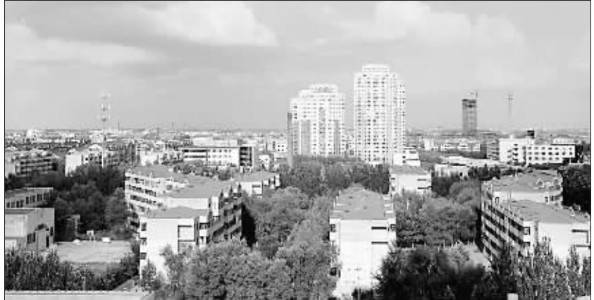
美丽如画的职工居住区