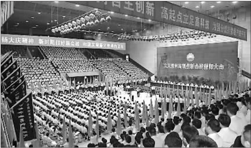
2008年，大庆油田全面打响新时期高科技新会战，为原油4000万吨持续稳产提供强有力的技术支撑，图为誓师大会会场。

多年来，大庆油田不断适应企业发展的需要，建立和完善以职代会为基本形式的职工民主管理和民主监督制度。凡涉及职工切身利益 的劳动、工资、奖金、住房、福利待遇等重大决策，必须经职工代表大会讨论审议通过，不断强化企业的民主管理；企业深化改革方案等重大政策和措施出台，都广泛征求职工群众的意见，由职工代表大会或是团组长联席会议审议通过后才正式实施。近年来，按照有关要求，他们坚持实行职工代表大会民主评议领导干部制度，重点抓了对企业领导干部的民主评议、民主测评，并将测评结果和干部的奖惩使用结合起来，促进了企业各级领导班子建设和干部队伍建设。目前，大庆油田已经制定了20多项关于职工民主管理的规章制度，职工代表大会实现了“开展工作制度化，组织体系网络化，活动内容程序化，行使职权规范化”。现在，大庆油田每年职工代表大会提案的立案率都在85%以上，落实率达