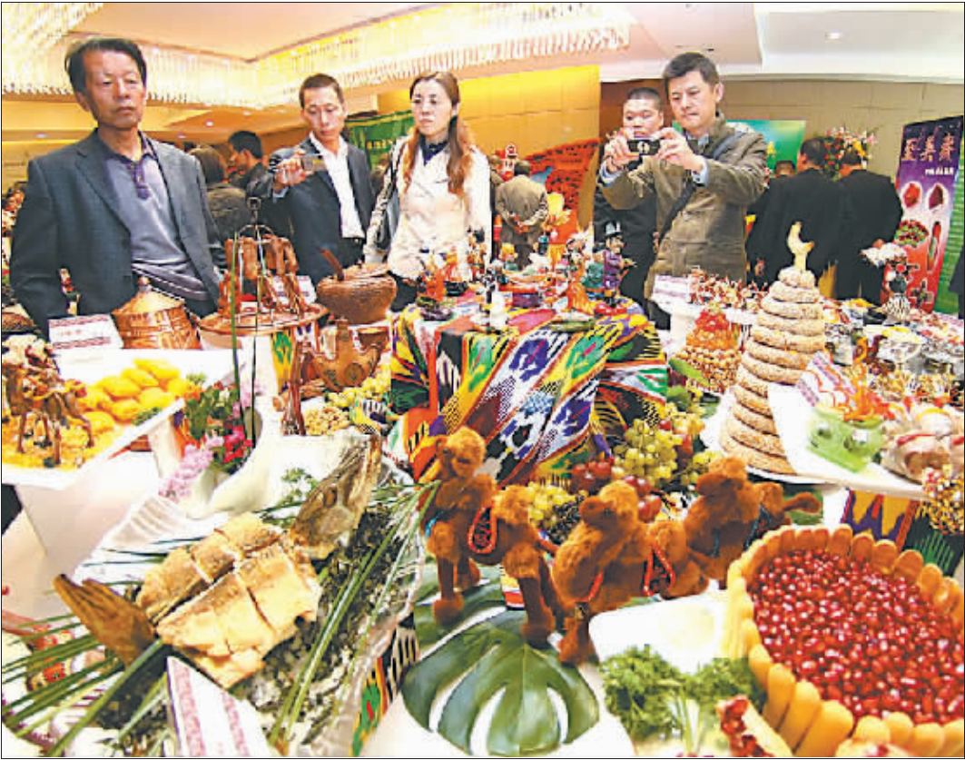
第十届中国美食节在津开幕

“我们将加强城市现有停车场的管理与使用，对已建成的配建停车设施加强其使用的监督与管理，对挪作他用的停车场应恢复其原有使用功能。”海口市市长徐唐先在谈到停车难问题时这样表示。