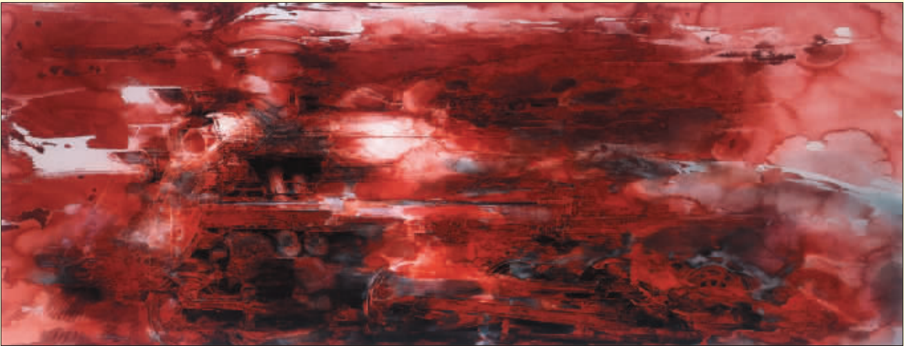
火车头精神(壁画/丙烯钢化玻璃材料)

本次入选展览的作品,有一半是未曾“上墙”的作品,更多在艺术形式、语言手法和装饰风格诸方面有探索性的作品,彰显出壁画创作在材质、材料及肌理效果上形式多样,光彩炫目;进一步促使壁画在创作题材和内容上更加广泛深入,表现现实生活和重大题材的作品明显增多;使得近 5 年来那些因客观原因未能在壁上实施的优秀创作得到展示。从此次展出的作品中,可以清晰地看到新中国几代壁画家是怎样释放热情,怎样大胆地求索而到今天的艺术境地。高品位、高质量的壁画创作,展现了强烈的中国气派和国家形象。 源源