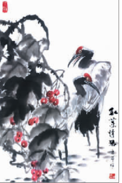
红叶情思(国画) 王平