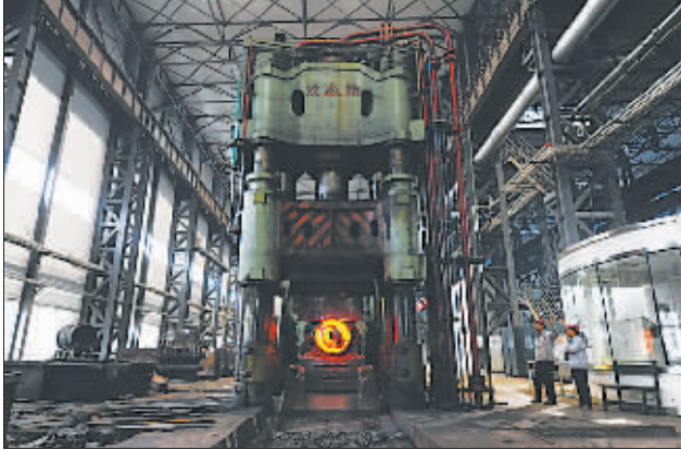
具有世界先进水平的沈阳铸锻工业有限公司,正在为相关行业的大型企业提供重工配套产品。