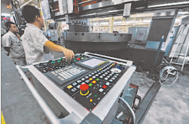
沈阳机床集团有限公司成套技术装备水平和在该领域的研发与制造能力已达国际先进水平。