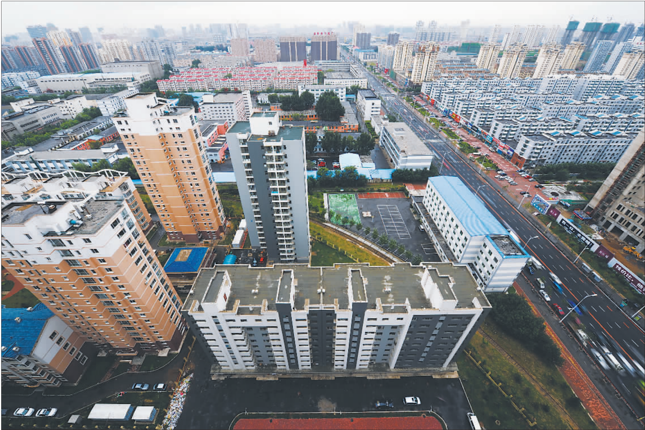
9月5日,登高俯瞰改造后的新铁西,现代化建筑拔地而起,国际化企业成群成片。

新世纪以来,国家实施振兴东北老工业基地的重大战略,铁西这个老工业巨人又采取了一系列脱胎换骨式的提升产业的改革措施,最终实现了自己的浴火重生。9月3日至5日,在铁西老工业改造和转型基本完成之际,本报记者作为辽宁省文联组织的中国摄影家采访团成员之一走进了铁西新区,结果,镜头里的铁西天蓝了、水清了、树绿了、路宽了、楼高了……一幅幅崭新的景象展现在了面前。