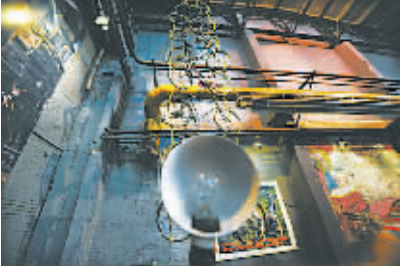
昔日上班的自行车