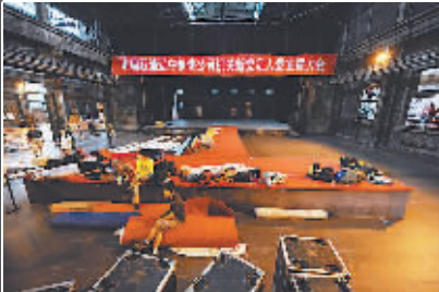
昔日老车间,今日T型台。