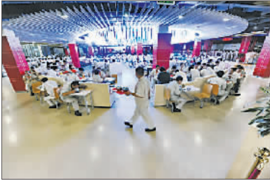
9月5日中午,沈阳机床集团有限公司的职工在充满现代韵律的餐厅中就餐。