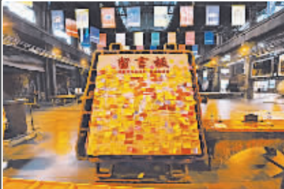
观者留言,抒发敬仰。