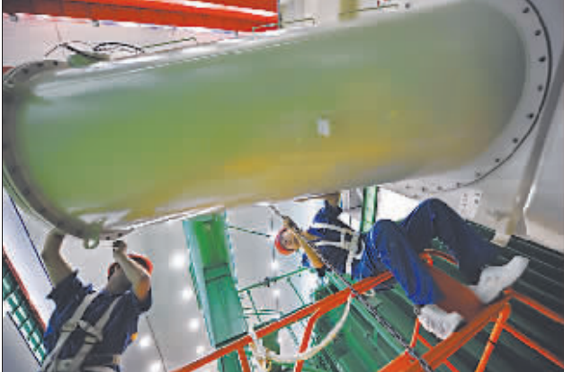
沈阳变电电工沈变集团的职工正在安装测试设备。该集团是世界产能最大的变压器企业之一。