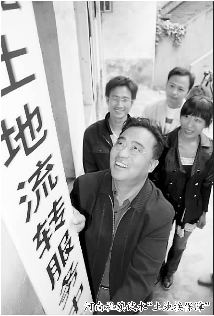
河南社旗试水“土地换保障”