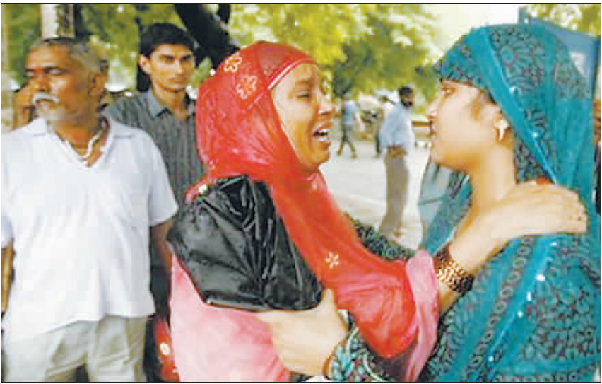
9月10日早晨,印度首都新德里一所公立学校发生踩踏事件,造成5名学生死亡,31名学生受伤,其中5人伤势严重。图为两位学生家长在事故现场相互安慰。

美国联邦储备委员会(央行)9日公布了最新一份“褐皮书”。分析人士认为,褐皮书发布的一些经济数据说明,美国的经济形势确实出现了好转迹象,进一步走向稳定。尽管目前美国经济仍然处于困难时期,但这些经济数据基本可以说明,美国经济避免了陷入长期衰退的危险,正在向复苏迈进,但复苏的过程仍然可能是漫长而曲折的。 美国经济褐皮书是联邦储备委员会编辑的关于国内经济形势的概要,因装订镶边颜色为褐色而得名。这种报告每6至8周公布一次,一年公布八次,是美联储召开政策会议之前的一份重要参考。该报告包括美国12个地方联邦储备银行所提出的地区经济情况摘要与全国经济情况摘要。在最新公布的这份褐皮书中,美联储称,美国经济情况正在走向稳定。 自上一份褐皮书在7月30日公布之后,