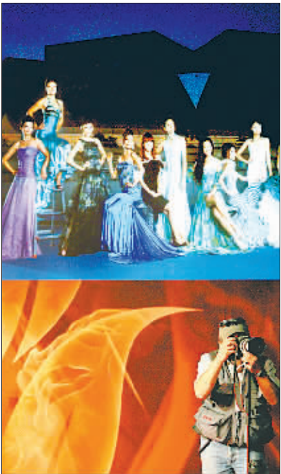
9月10日下午,中国网球公开赛官方对外公布了2009年中网冠军奖杯——中国之杯。同时,中网时尚队也宣布成立。图为一位摄影师在中网宣传画下面拍照。画中,时尚队的模特们在中网新的莲花网球场前留影。