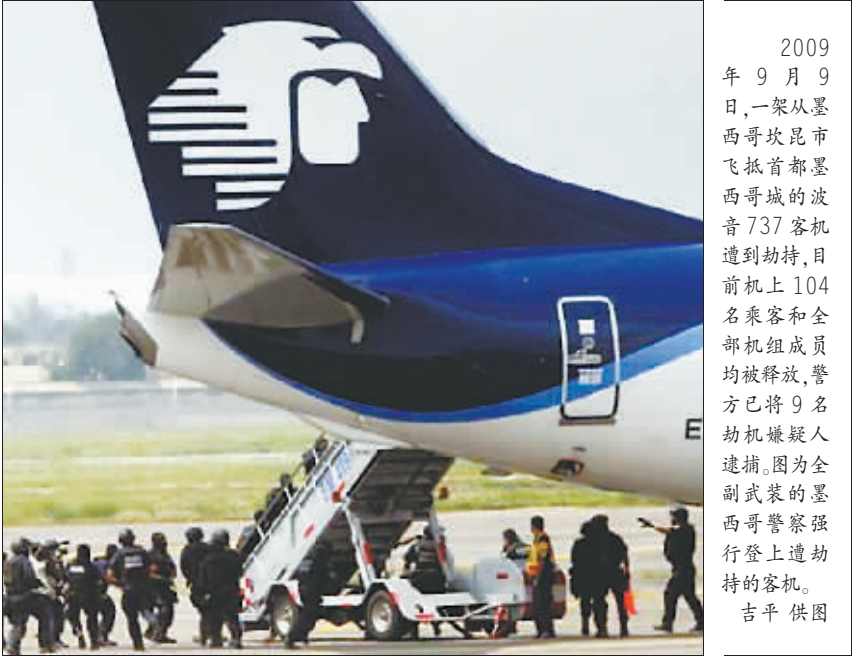
2009年9月9日,一架从墨西哥坎昆市飞抵首都墨西哥城的波音737客机遭到劫持,目前机上104名乘客和全部机组成员均被释放,警方已将9名劫机嫌疑人逮捕。图为全副武装的墨西哥警察强行登上遭劫持的客机。

以民主党党首鸠山由纪夫为首的日本新政府将于本月16日正式成立。中国总理温家宝9日在会见访华的日中经济协会代表团时,对日本民主党党首鸠山由纪夫在对华关系上的积极态度表示“赞赏”,并表示愿与日本新内阁加强沟通与合作,增进互信,继往开来,推动中日战略互惠关系持续深入发展。温家宝还表示,希望与鸠山早日会面。 温家宝总理的这一表态,反映了中国对未来日本民主党领导的日本新政府积极发展对华关系抱有期待,民主党的上台执政,给中日关系的进一步发展提供了新的条件。 中方对中日关系的这种期待,源自于即将上台执政的日本民主党在对待日本侵略历史问题上比较清醒的认识,如明确反对政治人物参拜靖国神社等,而该党对日本外交战略部署的调整,在外交格局的部署上持的是一种平衡的,而不像过去自民党政府过于偏向美国的外交理念,既重视与美国的关系,更要拉紧与亚洲尤其是亚洲邻国的外交关系,把日美关系、日中关系看得同等重要,也给东亚地区进一步加强政治经济合作,促进地缘政治稳定提供了新的可能。 从整个大环境讲,中日是主要经济体,互为重要贸易伙伴,更应携手应对金融危机的挑战。现在两国政府都认清了相互的经济上的依存性和相互互补的空间,两国在进一步